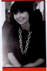
MOTHER & BABY