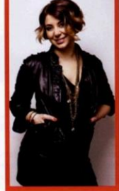
MOTHER & BABY 107

Hamilelik bir kadının en güzel, en güzel ve en mutlu anıdır. Hamile olan kadın ne giyse yakışır. Bu dönem, duygusal ve romantizmin doruğa olduğu bir dönem kadını için. Benim tasarımlarım birçok kadını akışkanlık ve rahatlık, hamileliğin bu dönemleri için ideal rahat, sık ve renkli. Bekli lerde hamileliğin son dönemleri için de bazı tasarımlar yapmam neden olmasın. Anımlar her zaman en güzelini hatırlıyor.